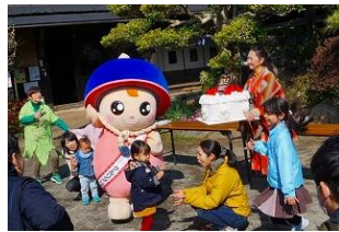
昨年は、くるりんもご来場の皆様を迎えてくれました

今年も実行委員会を立ち上げ、2日間の日程で春色フェスタが実行されることになりました。