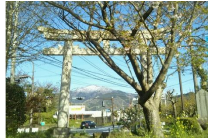
葉桜と季節外れの積雪の大山(4/14)